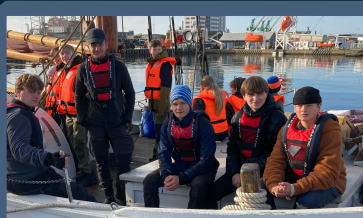
Udflugt med træsejlskib