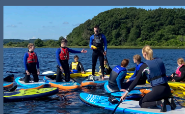
Stand Up Paddleboard

Maritim Camp 2024 i Frederikshavn handler om fællesskaber og aktiviteter på og ved vandet. Vi ønsker at samle unge fra hele Danmark med interesse for spændende maritime aktiviteter. Vi ser frem til en fantastisk weekend i samarbejde med Frederikshavn Ungdomsskole, hvor aktiviteterne vil være: