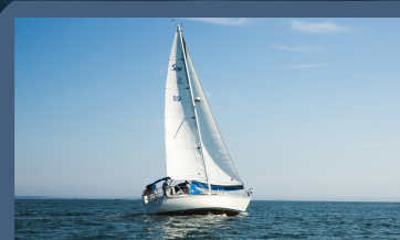
Sejle med match 28-både

Praktiske oplysninger: Campen åbner fredag den 30. august kl. 16.00 og lukker igen søndag den 1. september kl. 14.00. Opsamlingssteder vil være i følgende byer: Arden, Hadsund, Hobro og Mariager. Tidspunkt for opsamling vil blive annonceret senere. Vi kører fra Mariagerfjord ved 14-tiden. Det er gratis at deltage, men vi har begrænset antal pladser.